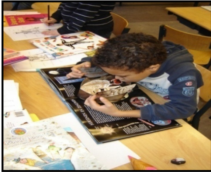
Een hersenonderzoeker in opleiding in groep 4.