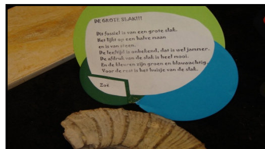
Kinderteksten over het thema de archeoloog